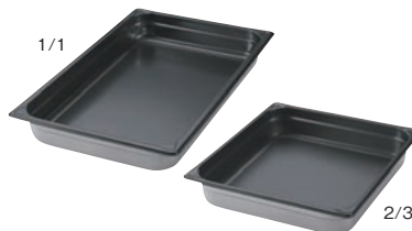
⑥EBM 18-8 ホテルパン ノンスティック加工

Check! ノンスティック加工 こびりつきやすい食材の調理に最適。 洗いやすくお手入れもカンタンで 時間と水道光熱費等を削減できます。