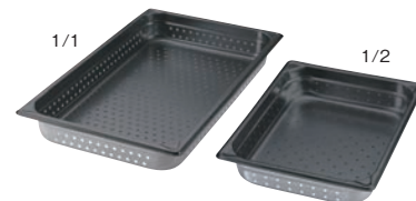
⑦EBM 18-8 穴明ホテルパン ノンスティック加工