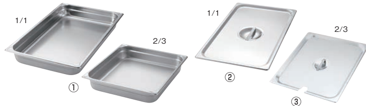
①EBM 18-8 ホテルパン