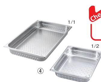
④EBM 18-8 穴明 ホテルパン